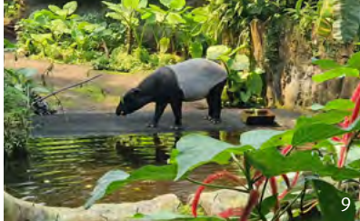
9 Zoo Leipzig: Unterwegs im Großstadt-Dschungel – im tropischen Regenwald Schabrackentapire entdecken 10 Nikolaikirche und -säule

entführt Besucher mit dem weltgrößten 360°-Panoramabild auf 110 × 32 m im Maßstab 1:1 mitten in einmalige Landschaften oder Schauplätze historischer Ereignisse.