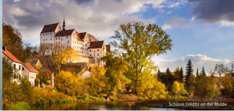
Schloss Colditz an der Mulde