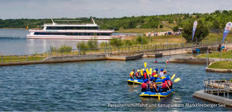
Personenschiffahrt und Kanupark am Markkleeberger See