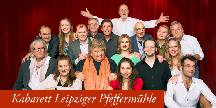
Kabarett Leipziger Pfeffermühle