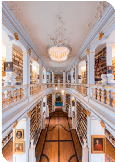
Biblioteca da Duquesa Anna Amália

● A arte em Weimar é uma combinação inspiradora de espírito clássico e vanguarda moderna. Aqui, as ideias de Goethe e Schiller encontram a radicalidade criativa da Bauhaus. O Museu Bauhaus Weimar e o Museum Neues Weimar apresentam ícones do design e visões arquitetônicas que marcaram toda uma época. Ao mesmo tempo, a Weimar Clássica convida a uma viagem artística no tempo, com a Biblioteca da Duquesa Anna Amália, o Palácio da Cidade e os locais de atuação dos grandes poetas. Em Weimar, a história não é apenas preservada de forma museológica – ela acolhe o visitante de braços abertos.