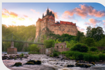
Castelo de Kriebstein

O Castelo de Moritzburg, situado em uma romântica paisagem de lagos, serviu de cenário para populares filmes de contos de fadas. Nas proximidades, o Castelo de Albrechtsburg, em Meissen, com sua catedral gótica, o jardim barroco de Großsedlitz, o Castelo de Weesenstein e a Fortaleza de Königstein estão entre os mais famosos dos inúmeros palácios e castelos imponentes da região.