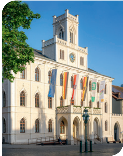
Prefeitura de Weimar