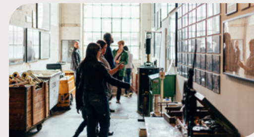
Spinnerei Leipzig (fábrica de fiação de algodão)

A arte contemporânea encontra seu espaço na Galerie Neue Meister, enquanto numerosos espaços alternativos e ateliês mantêm viva a cena criativa de Dresden. A combinação entre arquitetura barroca e arte moderna cria um contraste fascinante — impressionante, inspirador e sempre em diálogo com a história.