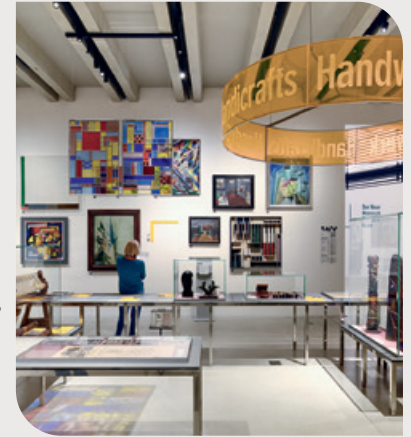
Museu Bauhaus Weimar

● A arte em Weimar é uma combinação inspiradora de espírito clássico e vanguarda moderna. Aqui, as ideias de Goethe e Schiller encontram a radicalidade criativa da Bauhaus. O Museu Bauhaus Weimar e o Museum Neues Weimar apresentam ícones do design e visões arquitetônicas que marcaram toda uma época. Ao mesmo tempo, a Weimar Clássica convida a uma viagem artística no tempo, com a Biblioteca da Duquesa Anna Amália, o Palácio da Cidade e os locais de atuação dos grandes poetas. Em Weimar, a história não é apenas preservada de forma museológica – ela acolhe o visitante de braços abertos.