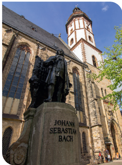
Monumento a Bach em frente à Igreja de São Tomás

Os amantes da arte vivenciam uma metamorfose criativa no que outrora abrigou a maior fábrica de algodão da Europa: hoje, a “Spinnerei” (Fábrica de Fiação) é um centro de arte contemporânea de renome internacional. Museus, galerias e o patrimônio industrial conferem à cidade um toque criativo e vibrante.