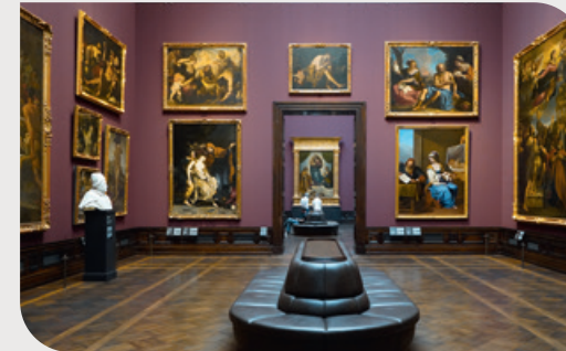
Galeria de Pinturas dos Mestres Antigos de Dresden

● A arte em Dresden é tão multifacetada quanto rica em tradição. As Coleções Estatais de Arte, com onze museus — entre eles o famoso Albertinum e a Galeria de Pinturas dos Mestres Antigos — estão entre os museus mais importantes da Europa.