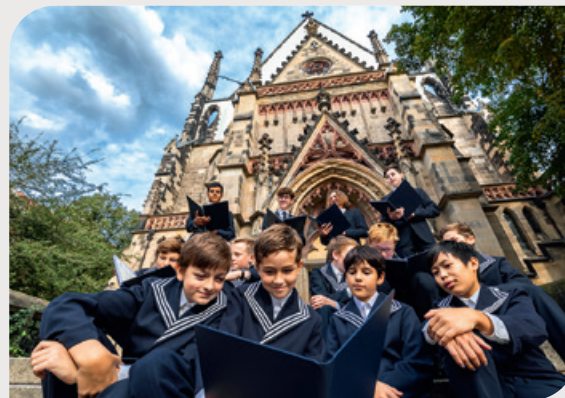
Coro de São Tomás

● Leipzig é a cidade da música. Compositores importantes como J. S. Bach, Mendelssohn e Schumann escreveram aqui suas obras-primas musicais. Com a Gewandhaus, a Ópera de Leipzig e o Coro de São Tomás, o coração da música clássica continua pulsando na cidade. Através de festivais como o Bach-fest ou o Festival de Jazz, e de uma cena musical vibrante, Leipzig encanta com toda a diversidade de sua cultura musical viva.