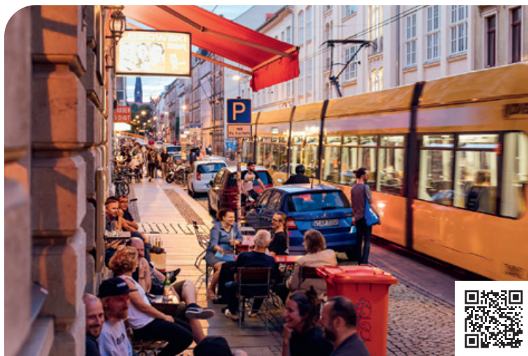
Ambiente noturno no bairro de Neustadt, em Dresden

Os vinhedos do Vale do Elba, com suas vinícolas, castelos encantadores e vilarejos idílicos entre a cidade da porcelana de Meissen e a cidade renascentista de Pirna, na entrada das românticas formações rochosas da Suíça Saxônica, fazem de Dresden um destino único para o deleite cultural e o relaxamento.