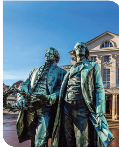
Praça do Teatro com monumento a Goethe e Schiller

No coração da Alemanha encontra-se um tesouro cultural de relevância mundial: Weimar – cidade dos poetas, pensadores e designers. Reconhecida três vezes pela UNESCO, ela reúne, de forma única, herança clássica, design de vanguarda e excelência musical.