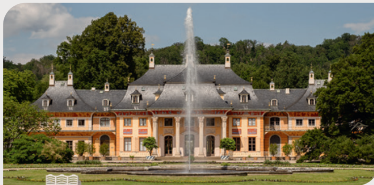
Palácio de Pillnitz

Dresden possui palácios mundialmente famosos. O Palácio Zwinger, em estilo barroco, e o Palácio Real encantam os visitantes com sua arquitetura e coleções opulentas, enquanto o Palácio Pillnitz, às margens do rio Elba, impressiona com seu toque de inspiração chinesa.