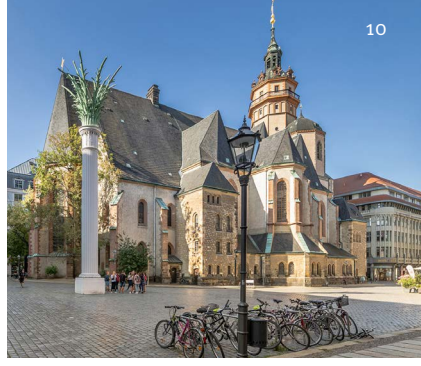
9 Der „Natur auf der Spur“ im Zoo Leipzig: Auf dem Urwaldfluss Gamanil in Gondwanaland 10 Nikolaikirche und -säule