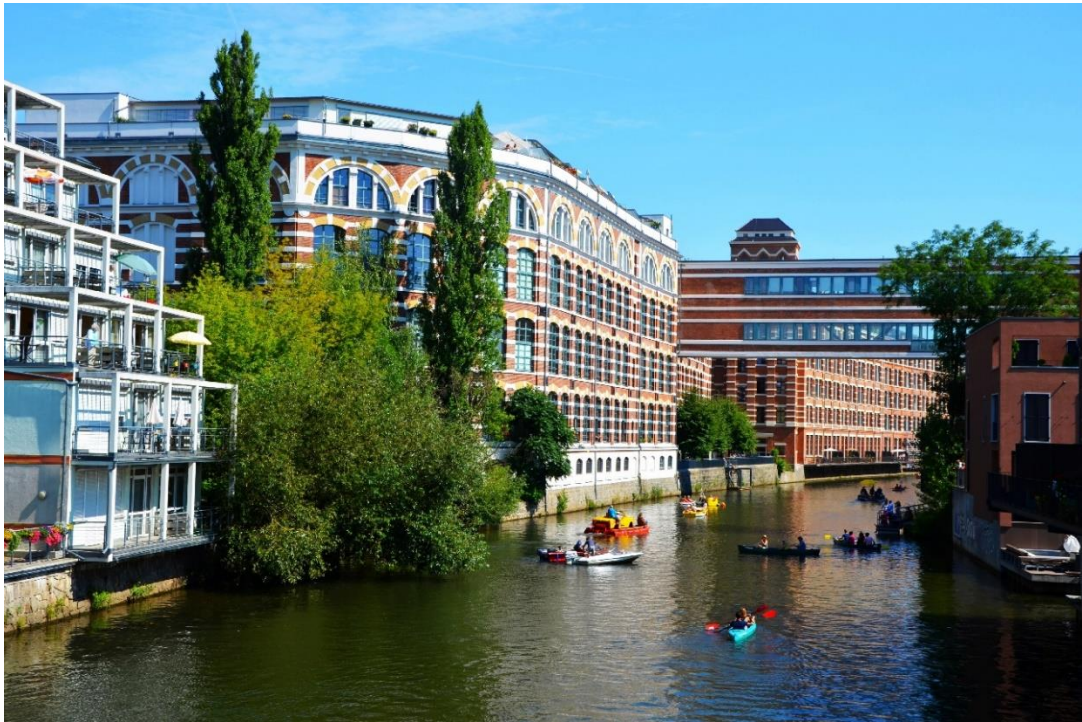
Ehemalige Buntgarnwerke an der Weißen Elster in Plagwitz