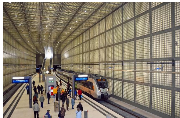
City-Tunnel – Station Wilhelm-Leuschner-Platz