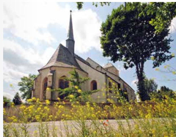
Geißler-Orgel in St. Marien Eilenburg

Begleiten Sie uns zur jährlich stattfindenden Orgeltour und lauschen Sie den Klängen der Region Leipzig. Die erste Station führt uns nach Beucha in die Bergkirche am Steinbruch, aus welchem die im Völkerschlachtdenkmal verbauten Steine gewonnen wurden. Anschließend besuchen wir die Kirche in Panitzsch mit einer Flemming-Orgel aus dem Jahr 1784/85. Nach einem kleinen Imbiss fahren wir weiter nach Eilenburg. Die Kirche St. Marien beinhaltet eine Geißler-Orgel aus dem Jahr 1862.