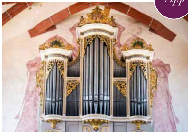
Silbermann-Orgel in der Marienkirche Röttha

Einen Kulturgenuss ganz anderer Art versprechen die klangvollen Orgeln bekannter Baumeister wie Silbermann und Kreuzbach. Der beachtliche Reichtum und die Vielfalt an spielbaren Orgelinstrumenten ziehen jedes Jahr viele Musikliebhaber in die Region.