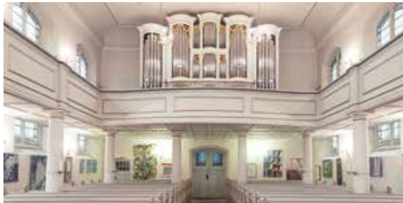
Fischer & Krämer-Organ

2. SonnAbendMusik am See Orgel und Vokalensemble „Tenuto“