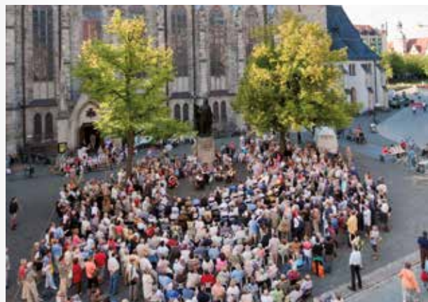
Thomaskirche mit Bachdenkmal