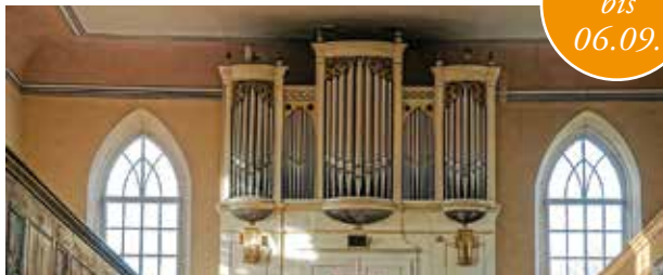
Kirche Hohnstädt mit Kreuzbach-Orgel